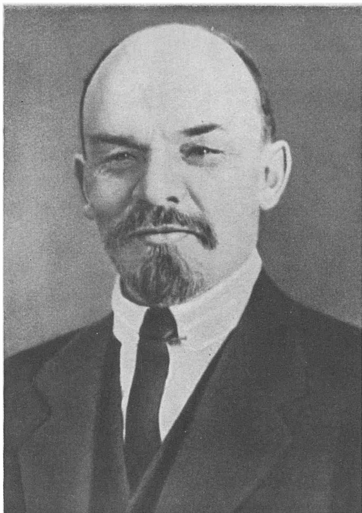
V. I. LENIN